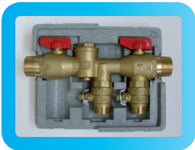
Füll- und Spülarmatur