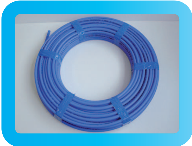
Rohrleitungen (20 × 2,0 mm) mit Formstücken